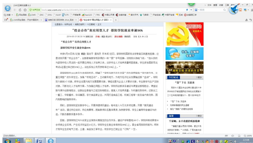
图 8 《湖南日报》对学校人才培养模式和毕业生就业情况的报道

学校通过信函、网络、电话、走访、电子邮件等形式对近 2 届部分毕业生工作单位开展跟踪调查，共收回调查问卷 242 份。调查结果显示，用人单位对学校教学、就业工作的满意度高，对学校专业设置、工作稳定性和总体评价等 11 项工作的满意度均在 96% 以上（见表 11），满意度均值处于 3.26 ~ 3.53 分之间（见图 9）。