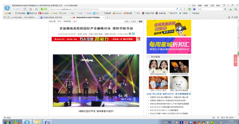
图4 媒体报道学校荣获湖南省首届高校校园好声音大赛冠军

学校先后举办了首届大学生创业文化节、第六届大学生辩论赛、 “校园好声音”大赛等校园文化活动，荣获湖南省第四届大学生艺术 展演等16项省级赛事优秀组织奖，学生获省市奖励110余项，其中获湖 南省首届高校校园好声音大赛冠军，获湖南省第四届大学生艺术展演 一等奖5项。