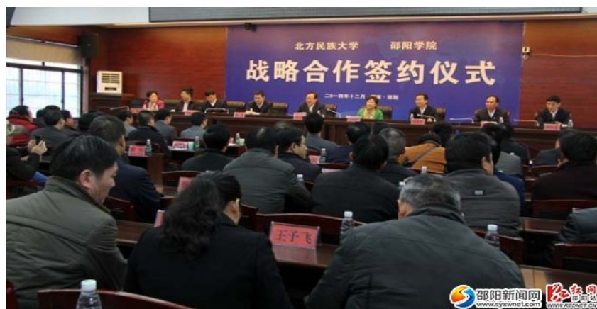
图1 学校与北方民大战略合作签约仪式

教学方法改革 深入推进研讨式教学改革，启动实施翻转课堂教学改革，以课程教学竞赛活动为载体，不断提升教师教学水平。2014年，学校获得湖南省普通高校教师课堂教学竞赛一等奖1项、二等奖2项、三等奖3项。