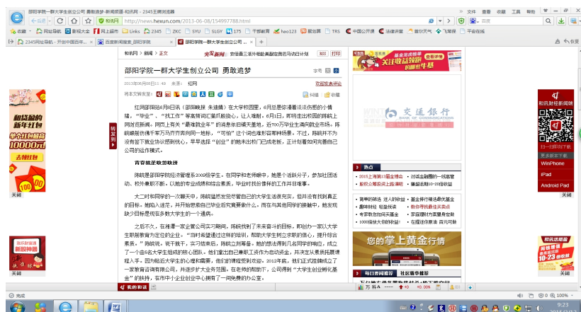
图3 媒体报道学校学生创业情况