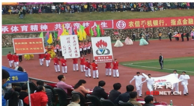
图6 学校第十一届田径运动会开幕式

2014年，学校举办了第十一届大学生田径运动会、大学生足球联赛、大学生篮球赛等体育竞赛活动，增强了学生体质，丰富了学生课余生活。